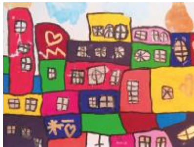
Ein Haus für Arty Acryl auf Leinwand 2019, 100x80 cm