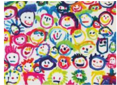
Kinderlachen Acryl auf Leinwand 2019, 80x80 cm