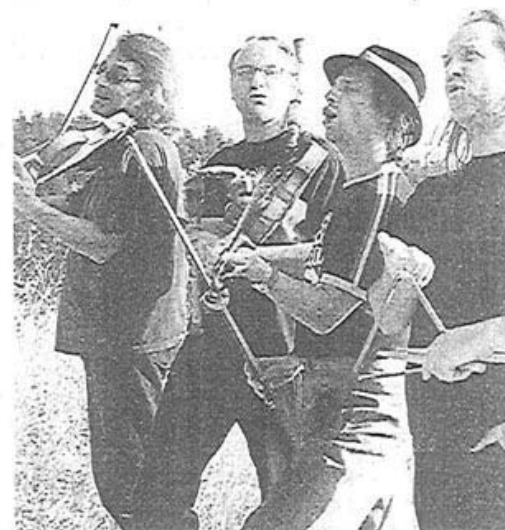
Aniada a Noar beim LKH-Familienfest