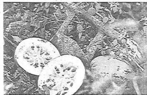
„Einkern“ auf der Steirischen Ölspur