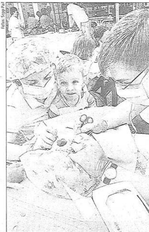
Wenn Teddy operiert wird staunt das Kind

Über die Live-Operationen staunten die Besucher nicht schlecht – der Patient war aber zum Glück aus Gummi... ▶